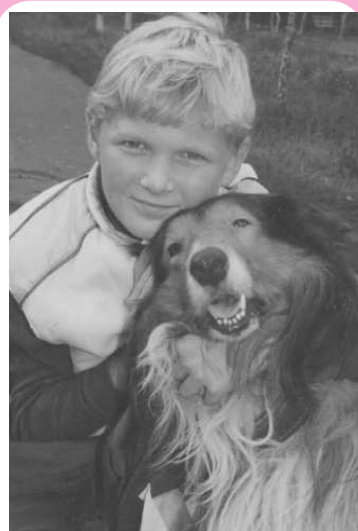
“Мой верный пес!”