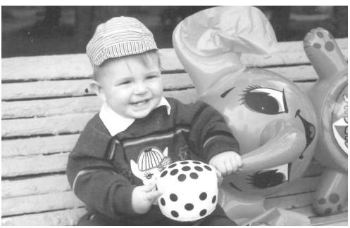
Счастье в нас, мы и есть счастье!