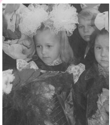
“Так начинаются школьные годы...”