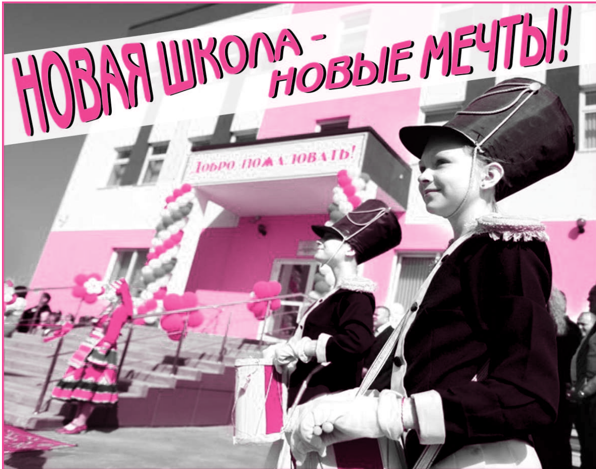
“В Рузаевке открылась новая школа” читайте на стр.14

За 8 месяцев число умерших составило 660 человек, в августе — 81. Основными причинами смерти населения являются болезни системы кровообращения. Смертность от болезней нервной системы занимает вторую позицию среди всех причин, на третьем месте смертность от новообразований. В органах ЗАГСа были заключены 154 брака, в августе — 37. Кроме того, зарегистрировано за 8 месяцев 169 актовых записей о разводе, из них в августе — 28.