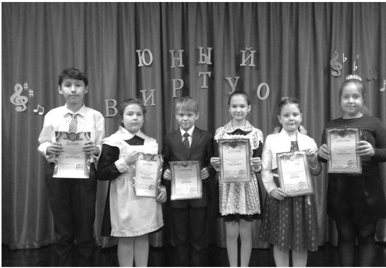
Мы желаем всем преподавателям и ребятам, которые будут защищать честь школы в республиканском конкурсе, творческих побед!!!