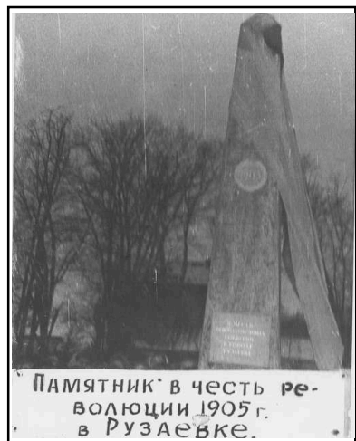
Фото № 8. Открытие обелиска в сквере клуба им. Ухтомского, 20 декабря 1960 г.