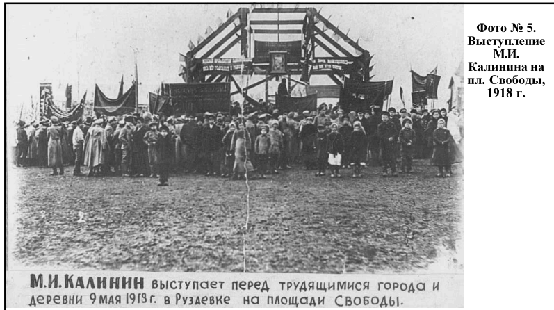
Фото № 5. Выступление М.И. Калинина на пл. Свободы, 1918 г.