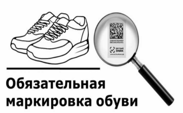
Обязательная маркировка обуви

С 1 марта 2020 года обувные товары будут маркироваться другим образом. Согласно закону, отныне необходимо обязательно наносить маркировку на упаковку обуви. Помимо этого, на коробке обязательно должен быть товарный ярлык. При несоблюдении установленных правил надзорные органы имеют право изъять товар либо выписать штраф. Продавцы обуви с 1 марта 2020 года вынуждены будут нести дополнительные затраты по нанесению ярлыков. По мнению россиян, в таком случае продавцам будет проще повысить цены на обувь, что скажется на покупательской способности граждан.