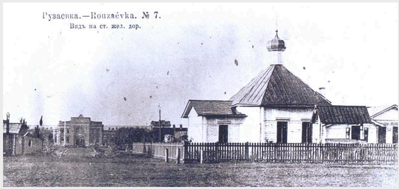
Рузаевка. — Рузаевка. № 7. Вид с ст. жел. дор.

Как и люди, памятники тоже проживают свои уникальные жизни. Ход времени неумолим, а людские жестокость и равнодушие делают своё черное дело. Речь пойдет об одном рузаевском памятнике истории – здании бывшего районного и городского краеведческого музея, расположенного по адресу ул. Куйбышева, дом 60.