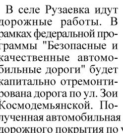
В селе Рузаевка идут дорожные работы.