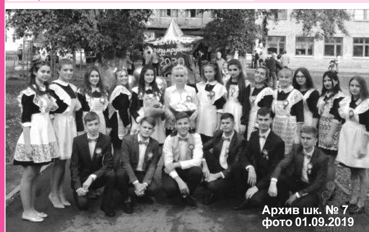
фото 01.09.2019

Даже повышенная готовность в городе в связи с пандемией коронавируса не помешала выпускникам присутствовать на последнем звонке, получить поздравления и напутствия. Впервые в Рузаевке это мероприятие прошло в уникальном формате онлайн-трансляции.